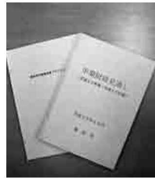
▲『登別市行財政改革プラン2010』と『登別市中期財政見通し』

このまちづくりを進めるに当たっては、基本計画の施策の推進として、限られた財源の中で計画的に事業の優先度や緊急度を計りながら、基本計画の施策に対応した事業を選択し、『目標への接近度を計る指標』の達成を目指すなど、基本計画の推進に努めるとともに、単年度においては、市政執行方針や実施計画ローリングなどにより、中期的な展開としては、市民との連携と信頼をもとに市民主体の行政経営の推進を図る『登別市行財政改革プラン