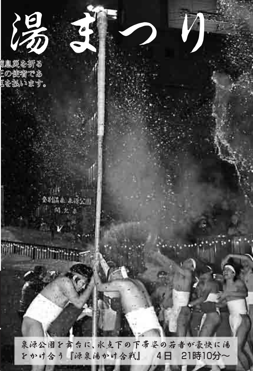
泉源公園と舞台に、氷点下の下帯安の若者が豪快に湯をかけ合う『源泉湯かけ合戦』 4日 21時10分～