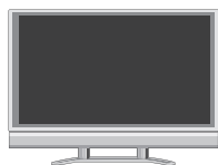
地上デジタル放送 対応テレビ