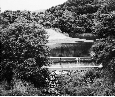
▲幌別浄水場取水口