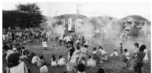
町内会子ども花火大会

問い合わせ 登別市連合町内会事務局（市民サービスグループ内 ☎ 0142 2139）