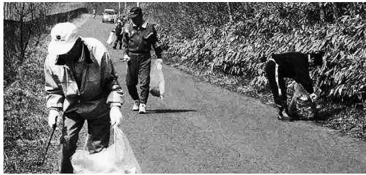
クリーンな町は町内会の自慢