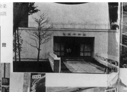
▲昭和32年オープンの『温泉科学博物館』