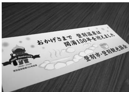
▲開湯150年を記念して作られたステッカー

平成2年7月には登別マリナーパーク、平成4年4月には登別伊達時代村がオープン。登別から登別温泉への道路は、自家用自動車の急激な普及や交通渋滞の解消、交通安全の観点から、平成9年には国道36号から紅葉谷交差点、平成12年には登別厚生年金病院からホテルまほろばまでが整備され、平成20年7月には続く第一滝本館までの整備と、登別パラダイスが建っていたところには泉源公園がオープンする予定になっています。