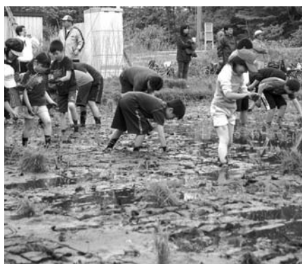
▲幌別中学校校区子ども地域交流プラザ運営委員会主催の『田植え』

登別市子ども会育成連絡協議会や子ども地域交流プラザなどと連携し、ボランティア活動や自然体験活動などの取り組みを通して、規範意識や他人を思いやる心など豊かな人間性をはぐくみます。