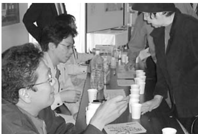
利き水アンケートの結果

その結果、登別温泉浄水場の水道水、ミネラルウォーター、幌別浄水場の水道水の順番になりました。おいしいという回答が多かった登別温泉浄水場の水道水は、源流から取水地点までの距離が短かいため、水質が比較的良好に保たれているものと思われます。