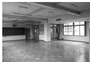
▲3階サークル活動室3