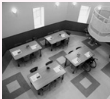
▲西いぶり地域生活支援センターのロビー