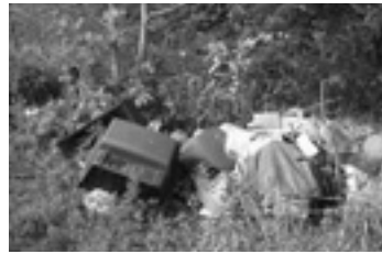
▲不法投棄の現場（柏木町）