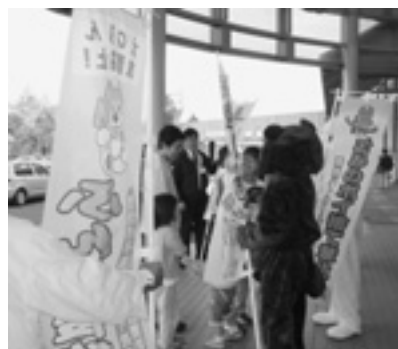
▲市内大型店舗での街頭啓発

月間において、『清潔で美しいまち』を目指し、次の事業に取り組めます。市民の皆さんのご協力をお願いします。