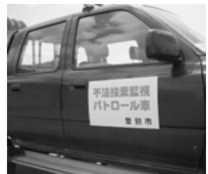
▲不法投棄防止ステッカーを装着した市の公用車