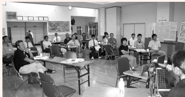
広域コンシェルジュ養成講座

これまで、地域を支えてきたボランティアガイドの皆さんを対象に、ガイドの専門的知識を学ぶ講座を開催し、地域のガイド全体のスキルアップを図ります。