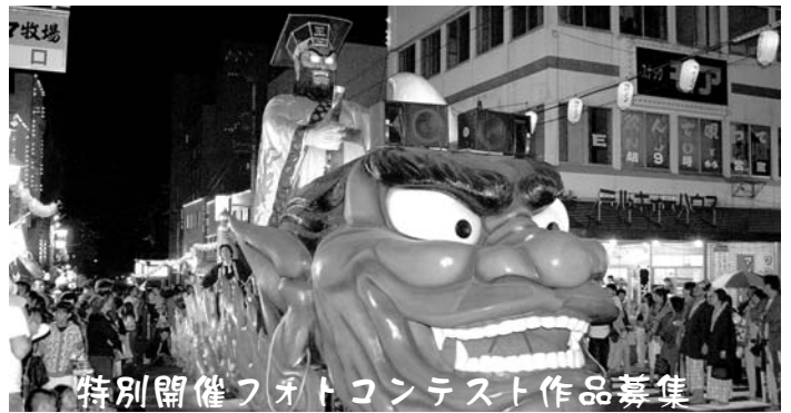
特別開催フォトコンテスト作品募集

躍動感や感動風景、新しい視点で撮るまつりシーンなど、あ なたのファインダーがとらえた、魅力ある作品を応募してみま せんか。