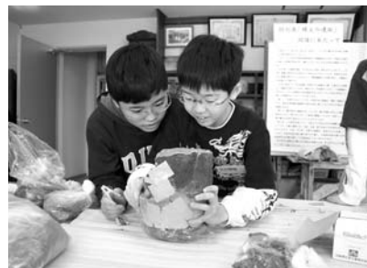
土器の復元作業体験