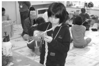
しめ飾り作り体験