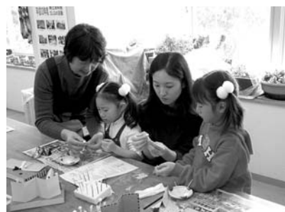
ひな人形作り体験