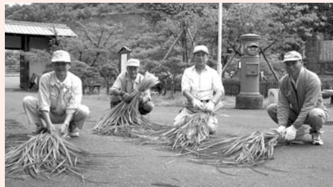
郷土資料館ボランティアグループ 『SLG』

隣の文化伝承館では、郷土資料館ボランティアグループ『SLG』の協力により、毎月第2・第4土曜日を中心に、こいのぼり作りやひな人形作りなど、さまざまな体験学習が行われ、日本の伝統文化を楽しく子どもたちに伝えています。