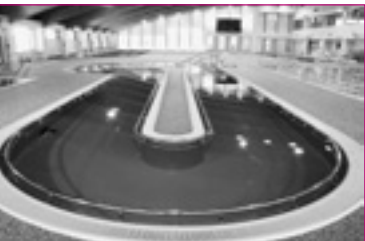
③歩行・流水プール