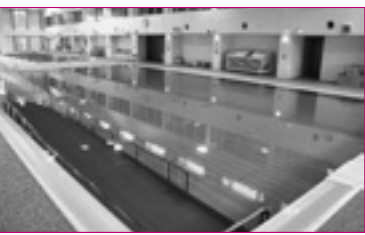
②多目的プール(可動床)