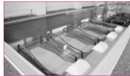
④リラクゼーションプール