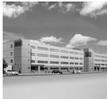
完成予想図(将来計画)