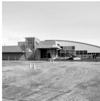
完成間近の新市民プール

多数の市民が楽しく利用できるよう管理運営に万全を期するとともに、利用者の便を図るため、新市民プールを経由するコミュニティバスの試験運行を実施します。