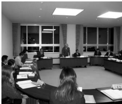
登別市の行動計画を策定する『登別市次世代育成支援行動計画策定委員会』

少子化の進行の流れを変えるため、市はこれまで『安心してこどもを産み、健やかに育てる環境』の基盤づくりに努めてきたところでありますが、国はさらに一歩進めた対策を推進する必要があるとして、『次世代育成支援対策推進法』を制定し、地方自治体や一般事業主、特定事業主それぞれが行動計画を策定し、協働し