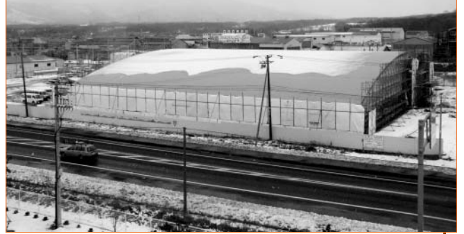
クリンクルセンターから見た新市民プール

平成15年度事業予算 12億7,939万円（うち、道補助金：1億円、市債：9億5,920万円、市債元利償還金の約50%が交付税に算入）