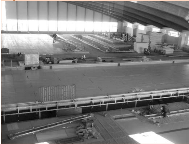
工事が進むプール内（手前は競技用プール、上左から多目的、流水、リラクゼーションプール）