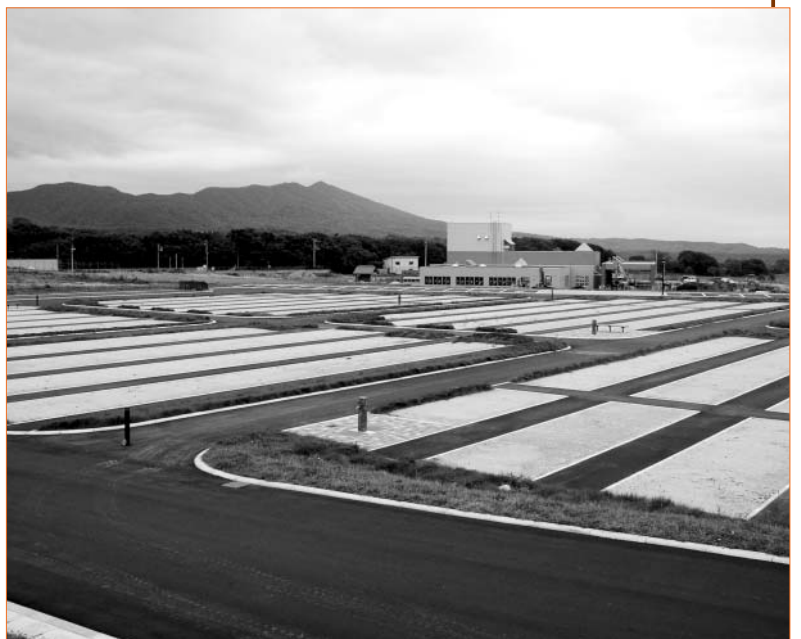
ゆったりとした第二富浦基地（正面の建物は新築した葬斎場）