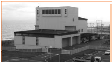
煙突などが撤去されストックヤード化が進む旧清掃工場

平成15年度事業費 2億7,943万円(うち、国の補助金:330万円、市債1億6,010万円、市債元利償還金の30%が交付税に算入)