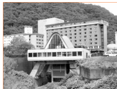
リニューアルオープンした登別温泉ふれあいセンター