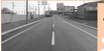
改良された中央通り (新市民プール前)

平成15年度事業費 2億3,640万円(うち、国の補助金:1億2,960万円、市債:1億1,530万円、市債1億980万円は元利償還金の30%が、550万円は50%が交付税に算入)