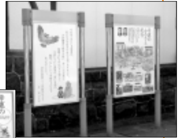
登別駅前に設置した 案内板