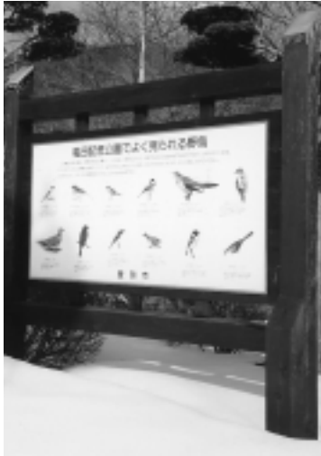
公園内に設置されている野鳥の解説板