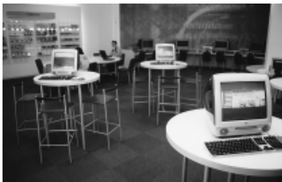
▲インターネットコーナーやAVコーナー、キッズコーナーなどを備えた『登別市地域情報センター』