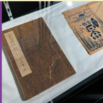
Immigration from Shikoku