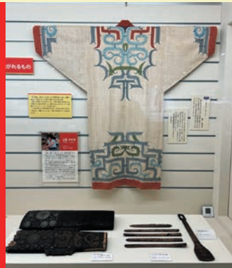
The History and Culture of the Ainu People