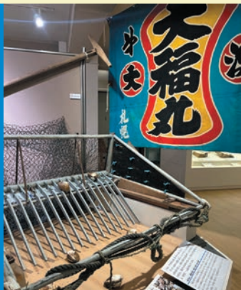
Noboribetsu City and the Fishing Industry