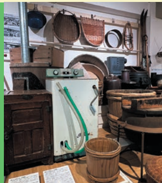
Daily Life Tools from the past

郷土資料館で登別市の歴史や文化を知って、マチに飛び出そう！ 今までとちがう、 マチの姿を見てみよう！