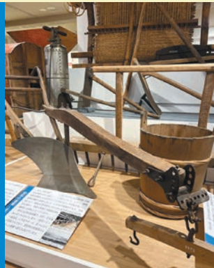
Noboribetsu City and Agriculture