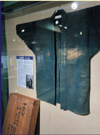
The Samurai's Immigration to Hokkaido