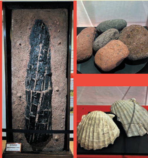
The Primordial ocean and what the Kuttara Volcano brought