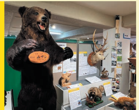
Animals Around Us