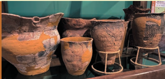
The Jomon Memories Lying Sleeping in the Place