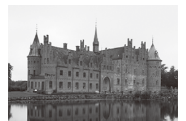
▲デンマークの代表的な観光スポットで『ニクス城』のモデルにもなった『イーエスコウ城』

ファボー・ミッドフュン市のあるデンマークは、スカンジナビアと呼ばれるヨーロッパ北部に位置しています。国土は大半が平地で、気候は温帯に属し、温暖で雨の多い冬と、涼しい夏が特徴の『幸福度の高い国』として知られている国です。