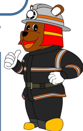
登別消防 公式キャラクター 【ぼん平くん】