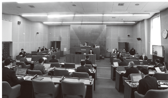
▲予算決算委員会の様子