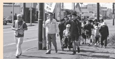
▲▼以前実施した訓練の様子