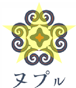
デザイン要素を加えての使用