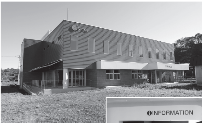
登別市観光交流センターヌプル (▲外観、▶内装)