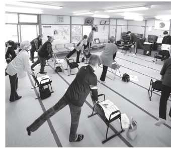
地域介護予防教室の様子 (◀東町2町会、▼月見草)