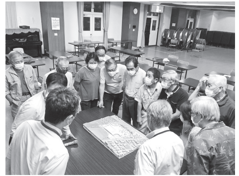
▲各地区での意見交換の様子