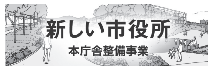
▲市公式ウェブサイトのトップページに設置するバナーのイメージ