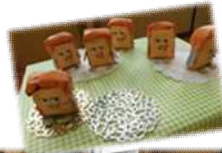
パンどろぼうの パンやさん