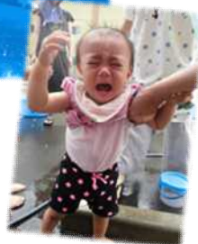
泣き顔も可愛い♡この後は元気に遊べました◎