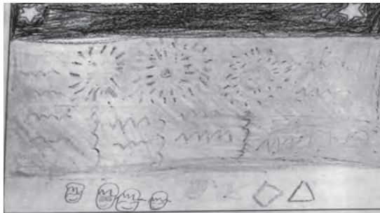
◀️キャンプ場で花火（8歳男の子）