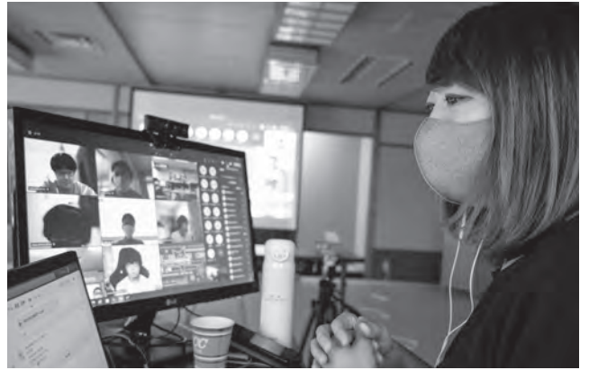
▲司会進行を務める日本青年会議所の会員