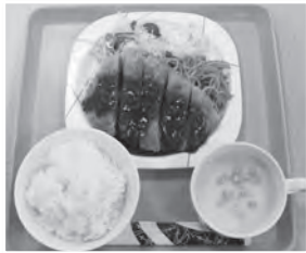
◀登別産豚肉を使用した「スパカツ」

肉厚でサクサクの豚カツと熱々のスパゲッティに、お腹を空かせた学生たちも大満足の様子でした。