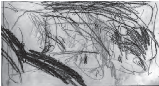
◀️初めての花火（2歳女の子）