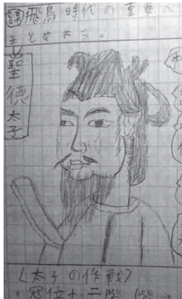
▲聖徳太子（小学6年生男の子）