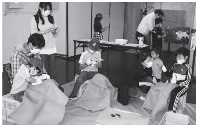
▲ナイフを作る参加者たち