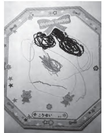
▲お父さん（3歳男の子）