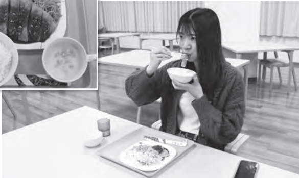
▲「スパカツ」を食べる学生