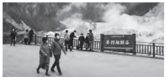
▲地獄谷展望台を散策する観光客

3月18日、「湯之国登別満喫キャンペーンのぼりべつ割」(登別国際観光コンベンション協会主催)の予約受け付けが始まりました。登別温泉・カルルス温泉に宿泊すると、最大5千円の宿泊割引を受けることができ、さらに3千円分のクーポンがもらえるこのキャンペーン。予約が殺到したため、初日の午前中に受付が一時中止となるなど、大きな反響がありました。 『のぼりべつ割』の利用が始まった3月25日(木)には、温泉街の散策を楽しむ観光客の姿が多く見られました。