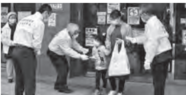
▲啓発物品を受け取る買い物客

より良いまちをつくるための基本的な心構えである市民憲章の普及のために行われたこの啓発活動。白いジャンパーに袖を通した同協議会の役員などが、市民憲章が印刷されたチラシが入ったポケットティッシュやクリアファイル、子ども向けに市民憲章を紹介する冊子を、行き交う買い物客に手渡しました。受け取った買い物客は、市民憲章の意義や大切さを再認識していました。