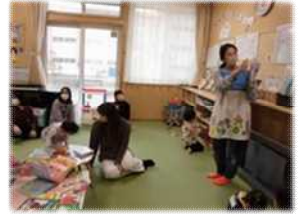
「頭が痛い」の手話 表情も100点◎