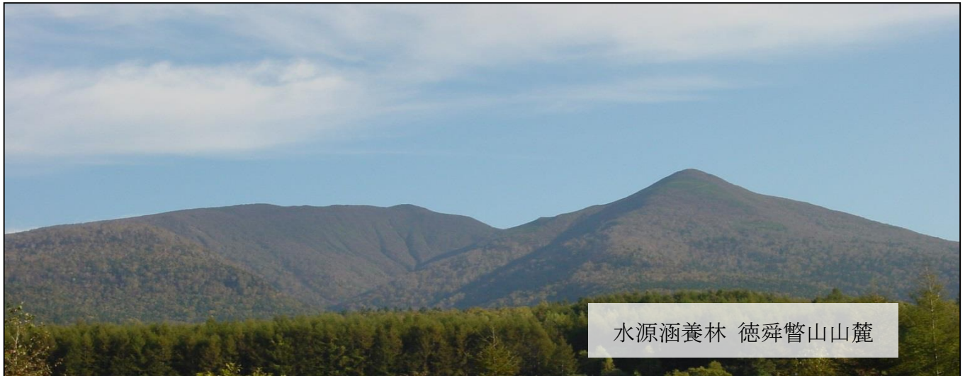
水源涵養林 徳舜瞥山山麓

■ 現状 水源涵養機能を有する森林は、上水道の供給源である水源を守り、育むために必要不可欠ですが、近年、全国各地で水源涵養林を含む森林の買収が相次ぎ、大きな社会問題になっています。 現在、多くの自治体で水資源を保全するための条例が施行・検討されていますが、かけがえのない国土を守るためには国全体での取り組みが必要です。