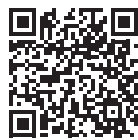
▲下水道事業会計のウェブサイト

※下水道事業会計の財務諸表などについては、下水道グループでの閲覧のほか、市公式ウェブサイトでも確認できます。