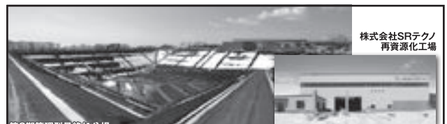
株式会社SRテクノ 再資源化工場

室蘭市東町2-27-4 セミナービル3階(東室蘭駅東口より徒歩1分・東室蘭郵便局となり) P有 http://www.hokkaido-mirai.com/