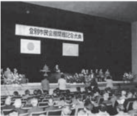
▲市内外から約500人が参加した開館記念式典

市民文化、コミュニティ活動の拠点の一つとなっている『登別市民会館』が開館したのは、昭和58年6月1日。この日、市民会館では、多くの参加者のもと、完成を祝う記念式典が盛大に執