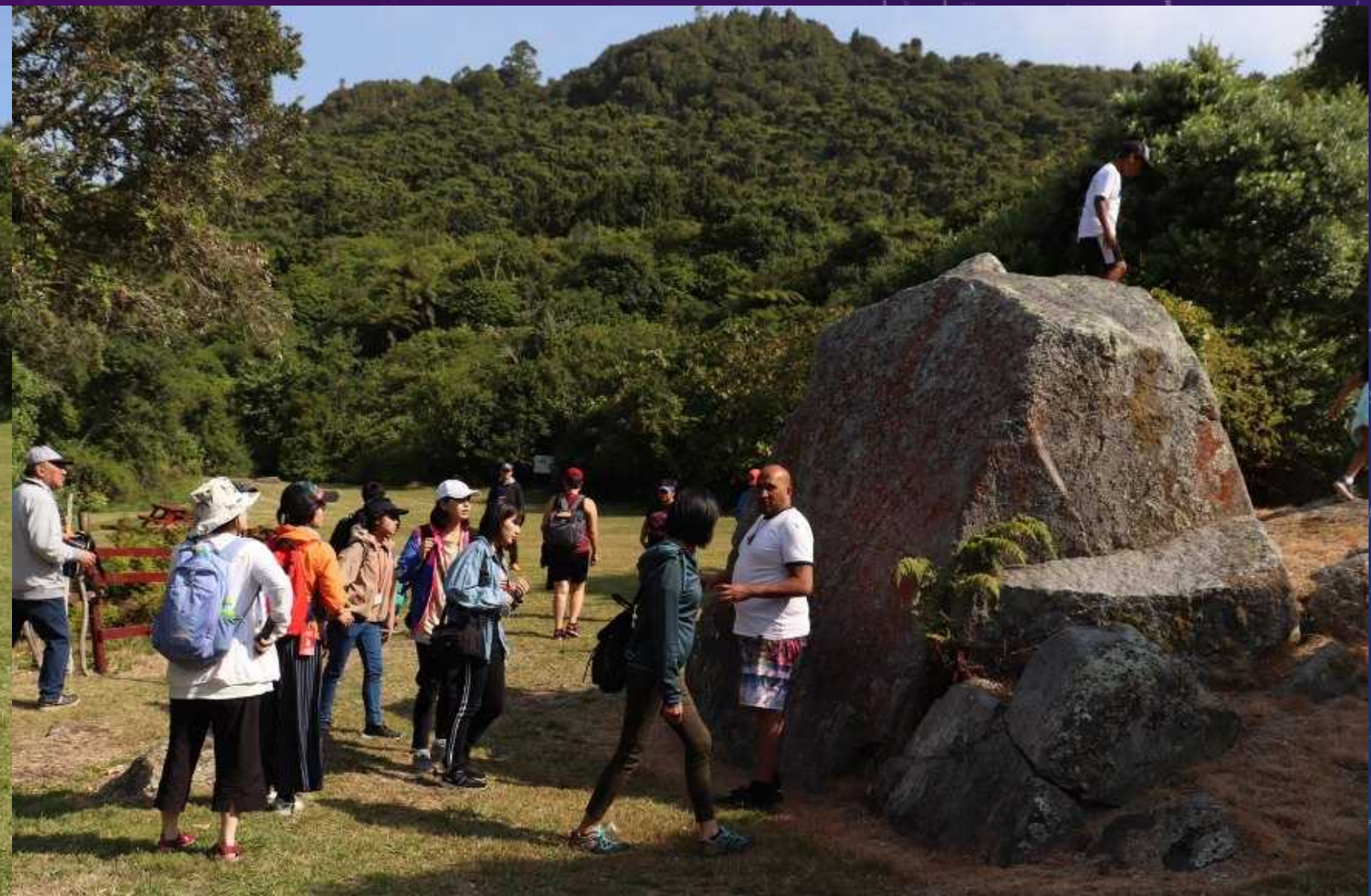
戦いの跡が残る聖なる岩