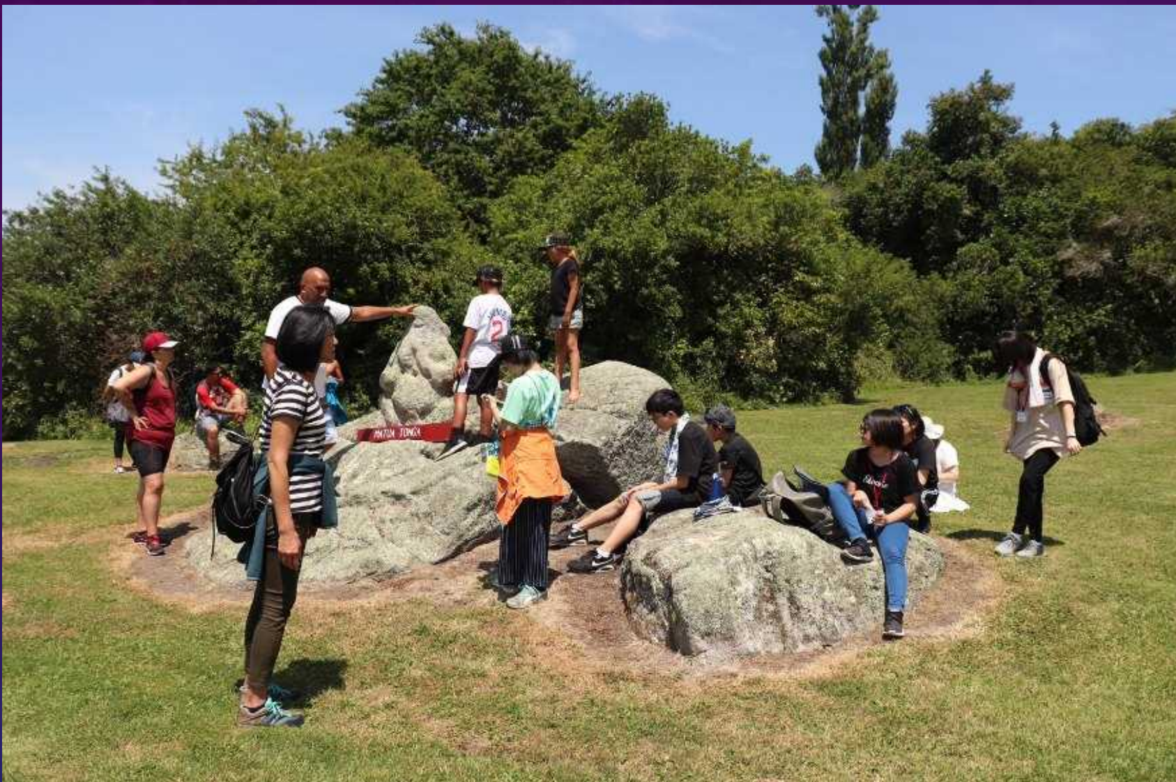
サツマイモの神様の岩