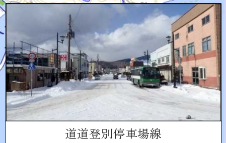
道道登別停車場線