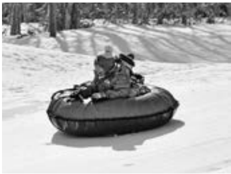
▲そりとは違った滑りを楽しむことができるスノーチューブ（ゴム製）

ラーメンのほか、地元産の食材を使ったこだわりの料理など、豊富にとりそろえていますので、食事も楽しむことができます。家族で楽しい冬の思い出づくりを試してみませんか。