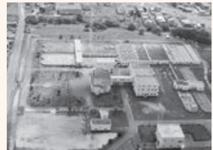
▲生活排水の処理を行う若山浄化センター