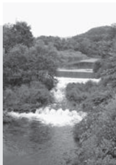
▲水源のひとつである来馬川

なお、平成29年3月31日現在の行政区域内人口49,090人に対し、給水人口は48,429人。水道普及率は98.65%であり、市内のほとんどの家庭に水道水を供給しています。