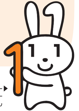
マイナンバー キャラクター マイナちゃん

今号では、さらに詳しく『通知カード』が届いた際の手続きの方法などをお知らせします。