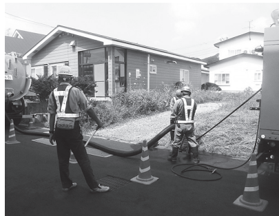
▲既設排水路の清掃作業