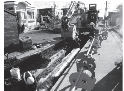
▲道路排水対策（雨水対策）工事