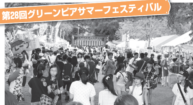
▲豊かな緑と露店のコラボレーション