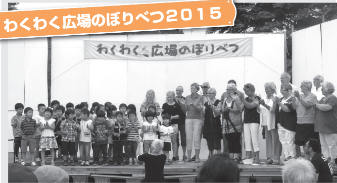
▲訪問団と幼児の歌声に包まれた会場