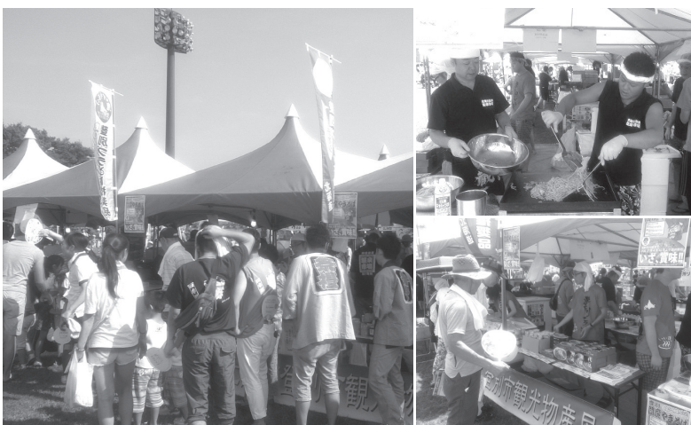
▲海老名市民に登別の食をお届け

9月5日(土)・6日(日)に登別市で開催する『幌別地区手づくり祭り』では、姉妹都市の海老名・白石の両市が地元産品を販売する予定です。