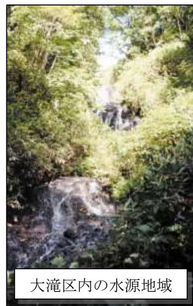
大滝区内の水源地域