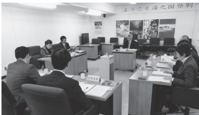
▲室蘭民報社から講師を招き開催した勉強会の様子

内容は、5W1Hや句読点などの基本的なことから、見出しやリード文の重要性など多岐にわたって有意義な講義をしていただきました。印象に残ったのは「議案の紹介や質問・答弁内容ではなく、議員個人の思いを前面に出すこと」でした。今回の勉強会を踏まえ、委員会としてさらに努力してまいります。