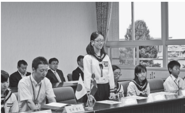
▲一人ずつ派遣の抱負を述べる生徒たち

ビンゴ大会で当たった賞品を手に抱え帰路につく子どもは、夏のイベントを楽しんだ、充実の表情を浮かべていました。