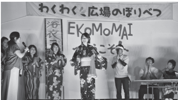
▲浴衣クイーンコンテスト

7月12日(土)・13日(日)の2日間、登別ビーチパークで『わくわく広場のぼりべつ』(同実行委員会主催)が開催されました。