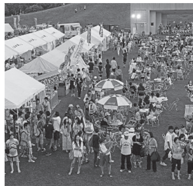
▲昨年の『第1回 のぼりべつ夏祭り』の様子

「市内でお祭りやイベントがあるときは、地区の垣根を越えて互いに助け合っています。こういった協力を得られることは、普段からつながりを持つていなければ難しいものです。今回の夏祭りもそういった多くの力により形作られています。ありがとうございますと感じています。これからも地区同士のつながりをより一層強め、大切に