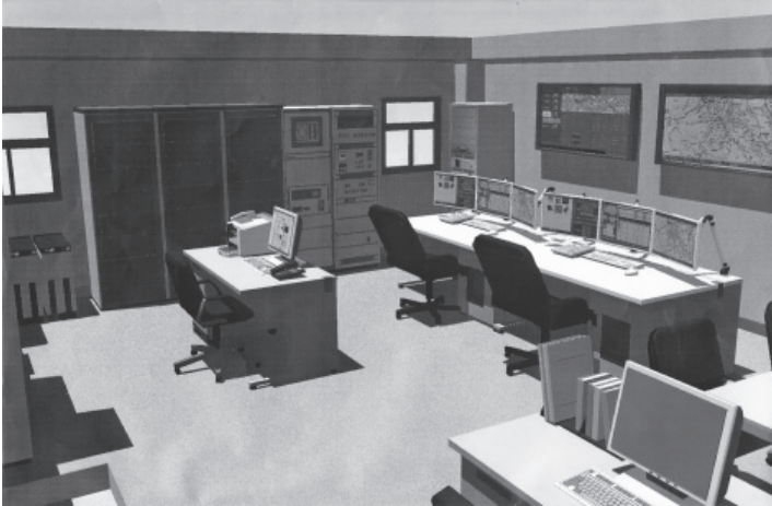
▲消防緊急通信指令システムのイメージ図