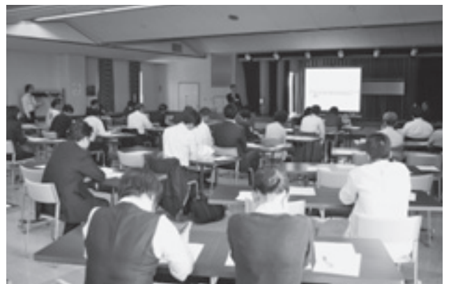
▲制度について理解を深める参加者

市内外の事業者など約40人が参加し、新しい制度や必要な手続きについて理解を深めようと、熱心に耳を傾けていました。