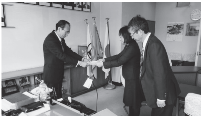
▲総務・教育正副委員長が調査報告書を議長へ提出する様子

登別市の高齢化率は、本年6月末現在で、31.3%となり高齢化が進んでいます。このような状況のなか4月28日、若草町2丁目に建設された「特別養護老人ホームわかさざ」が竣工式と開所式を迎えました。当委員会からは、5名の委員が出席して施設内の視察を行いました。この特別養護老人ホームは、「社会福祉法人友愛会」が運営する10ユニット100室の施設で、さわやか公園に隣接し住宅街に建つ市内2か所目の施設です。この施設の開所により、特別養護老人ホームの待機者の約半数が入居することができるとなっています。