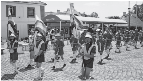
▲開幕を飾ったオニッコマーチングバンド