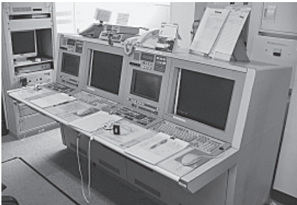
◀現在使用している消防緊急通信指令システム