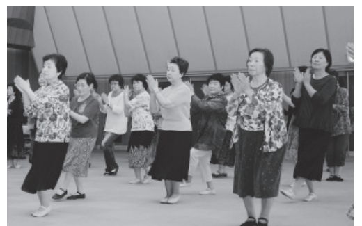
▲曲に合わせてダンスを楽しむ皆さん