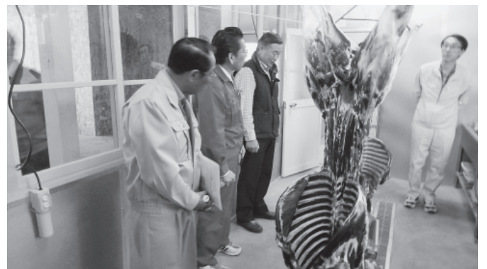
▲シカ肉処理場見学の様子