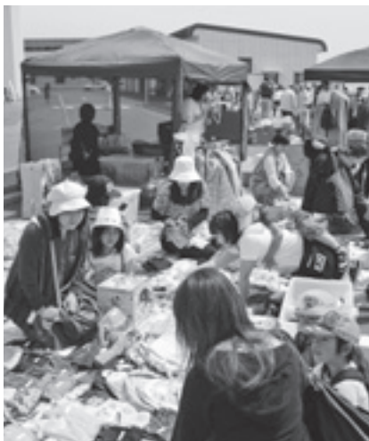
▲人気を博したフリーマーケットの会場