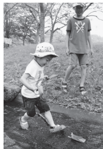
▲流れる笹舟を追いかける子どもたち