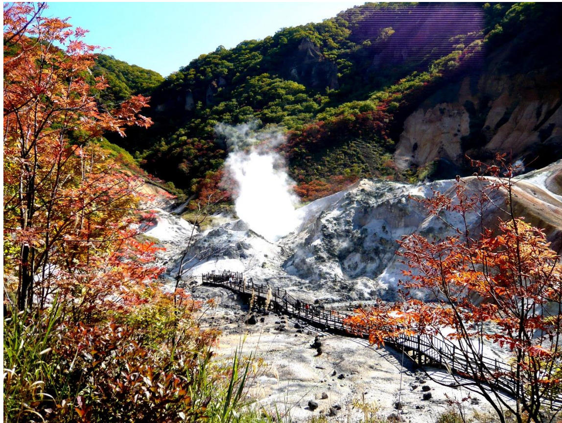
登別地獄谷 (のほりべつじごくだに)