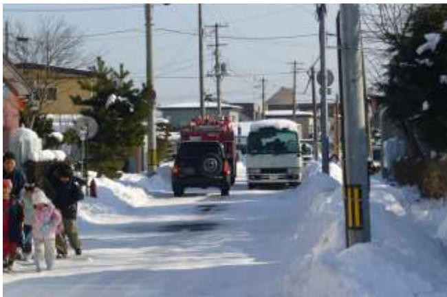
通学路としてたくさんの児童が歩行するが、歩道がなく道幅も狭いため大型車両が通行すると非常に危険である。

以上のように、本路線は幌別地区内における重要な路線であり、将来的にも交通需要が増加する状況にあることから、道道に昇格し整備していただくことを要望します。